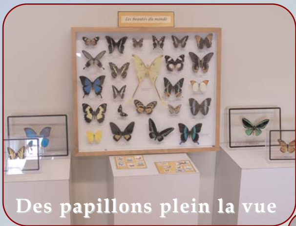
Des papillons plein la vue