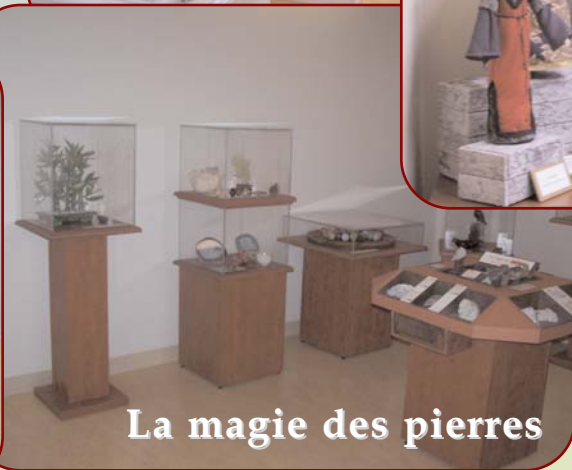
La magie des pierres