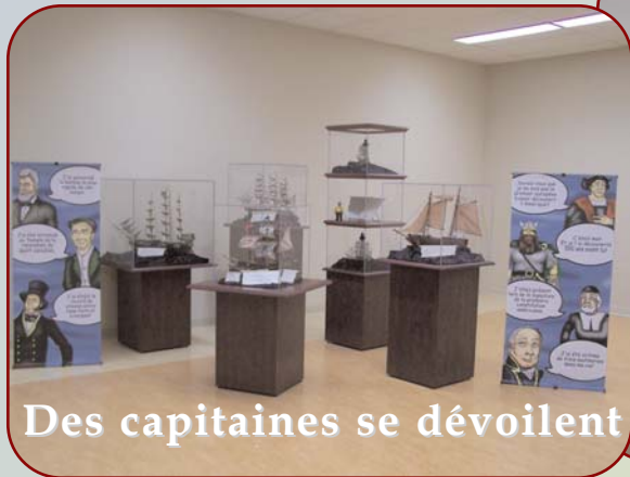
Des capitaines se dévoilent