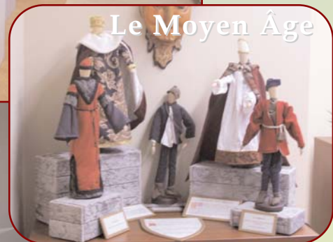
Le Moyen Âge