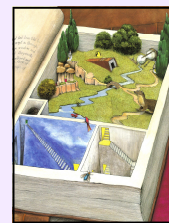
Illustration de Colin Thomson

C'est sous le magnifique thème: " IMAGINE " que le Club de lecture TD 2012 fera rêver, créer et inventer les enfants cet été.