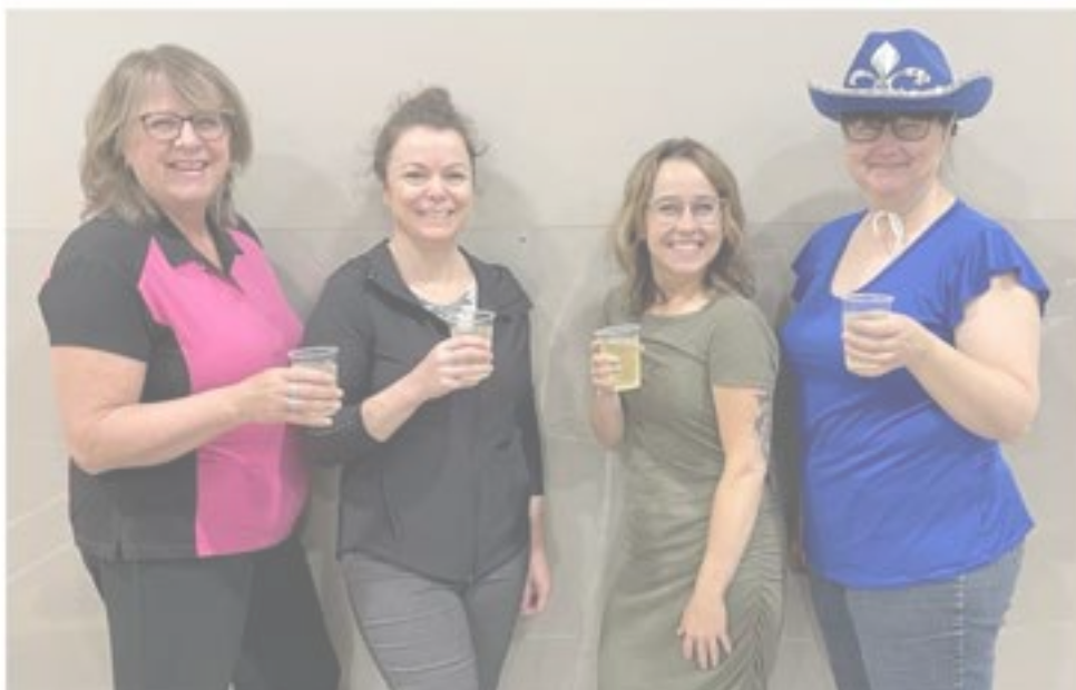
Équipe 2021-2022 de la CDC lors de l'activité de réseautage de l'été Tournoi de babette le 23 juin 2022