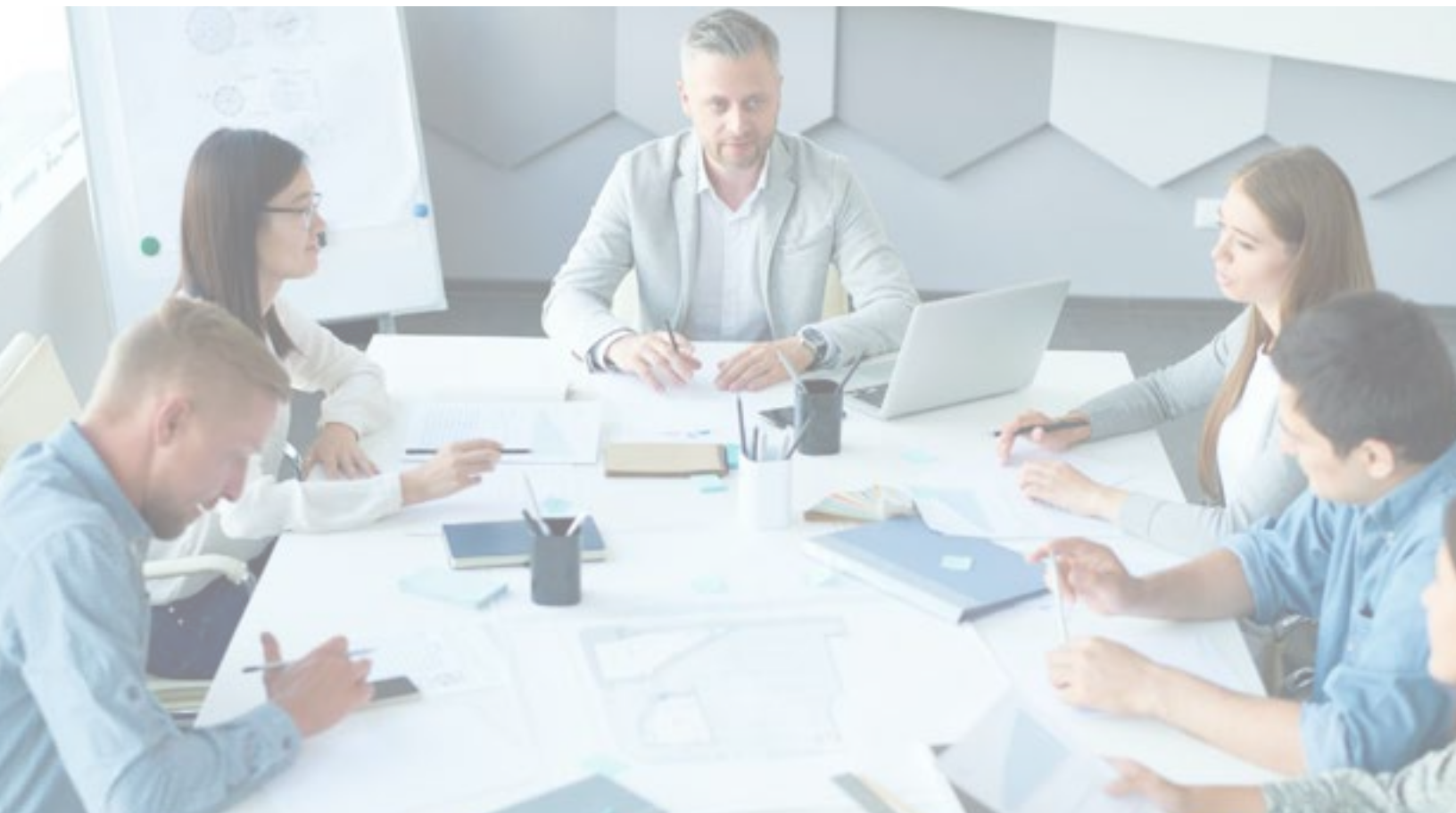
Table régionale de concertation des personnes âgées du Centre-du-Québec

Ministère des Affaires municipales et de l'Habitation