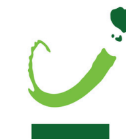
Table de concertation jeunesse de Sherbrooke